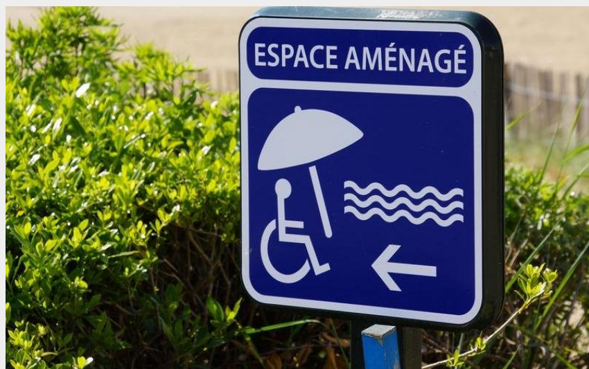
L'accessibilité à la Bernerie-en-Retz_1 (Virginie Lebreuvaud)