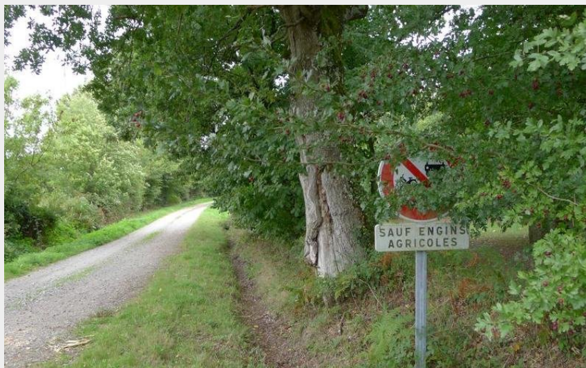
Autour de l'Ardivais_Besné_chemin chapelle Saint Second