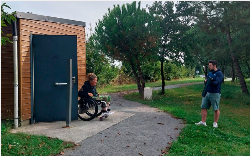
Chemin du Bois du Don - Accessibilité (CCCD/Dept 44)