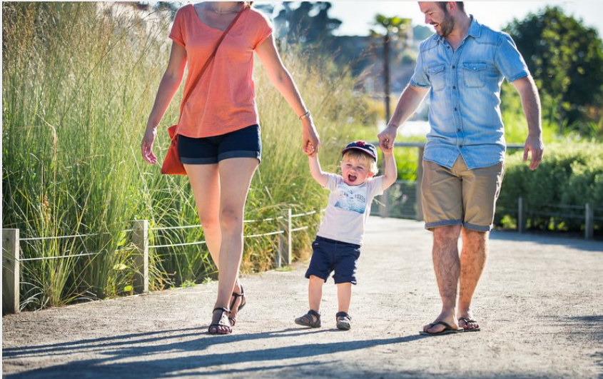
Le jardin botanique de la Ria à Pornic_1 (Mélanie Chaigneau)