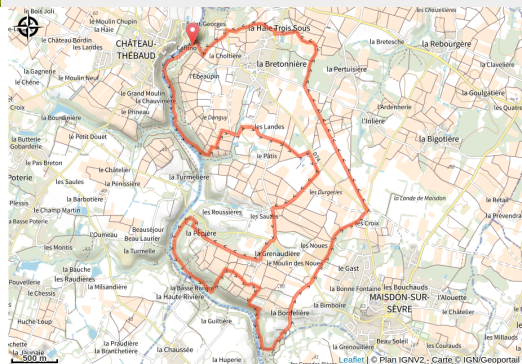
boucle pont caffino maisdon sur sevre (2)

Sous-bois ombragés, vignes colorées et la Maine comme fil conducteur pour cette balade grandeur nature !