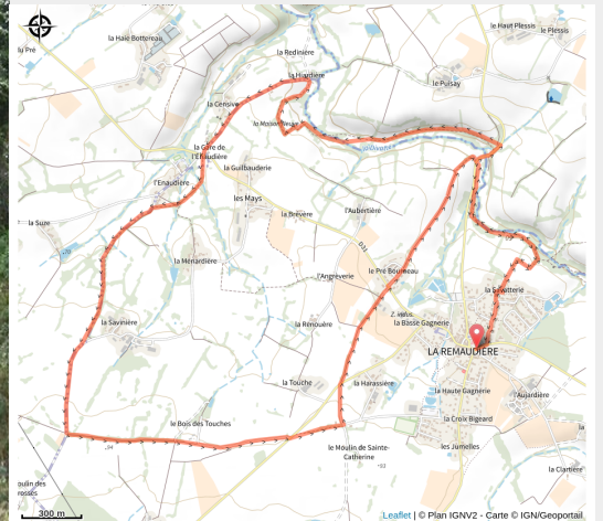
circuit-htedivatte-laremaudiere-levignoblenantes-tourisme (1)