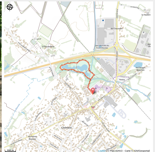
Circuit accessible à tous du plan d'eau de la Blanche à Chaumes-en-Retz (Chéméré)_1 (R. Santelli)