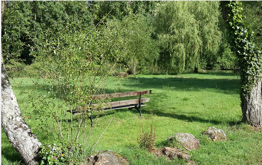
sentier des étangs et des calvaires (Anne Collet Bailleul)