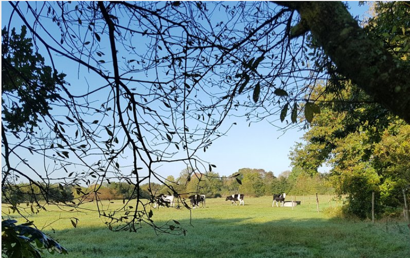
Marais de Vilaine_2