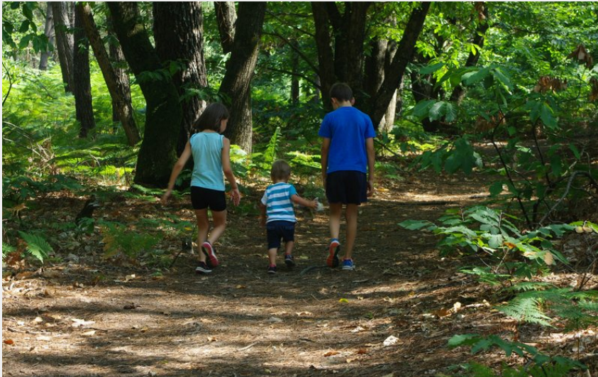
bernugat_7 (Office de Tourisme entre Brière et Canal)