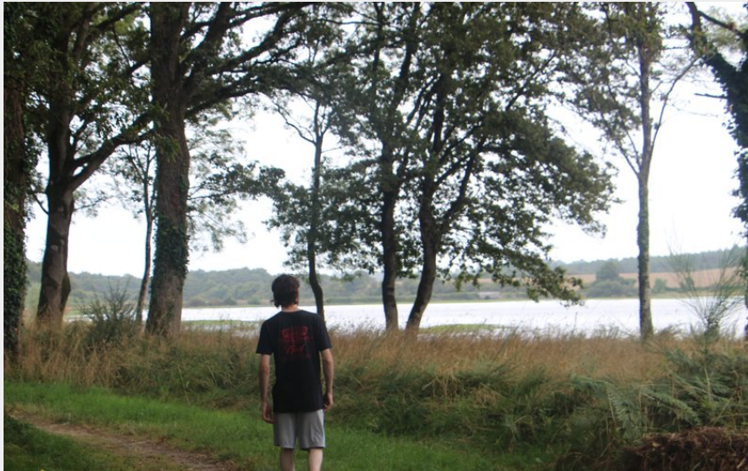
Circuit du lac de Vioreau (COMPA)