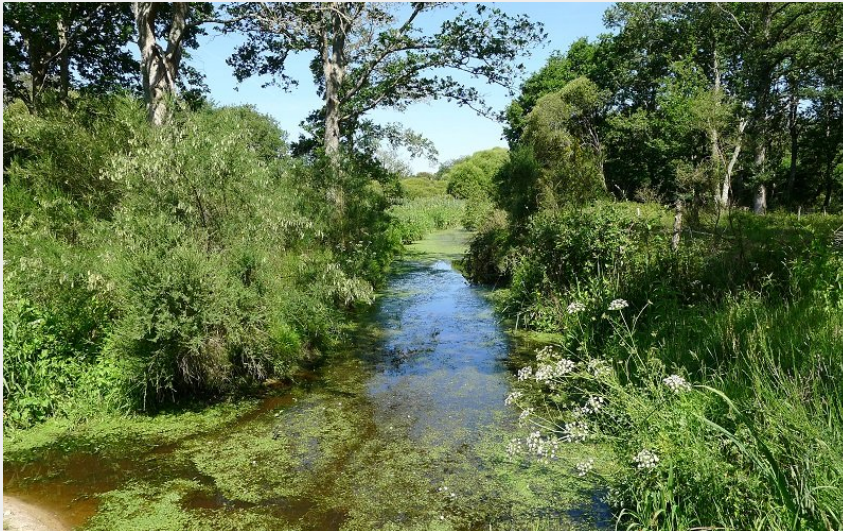
Le Vol du Colvert