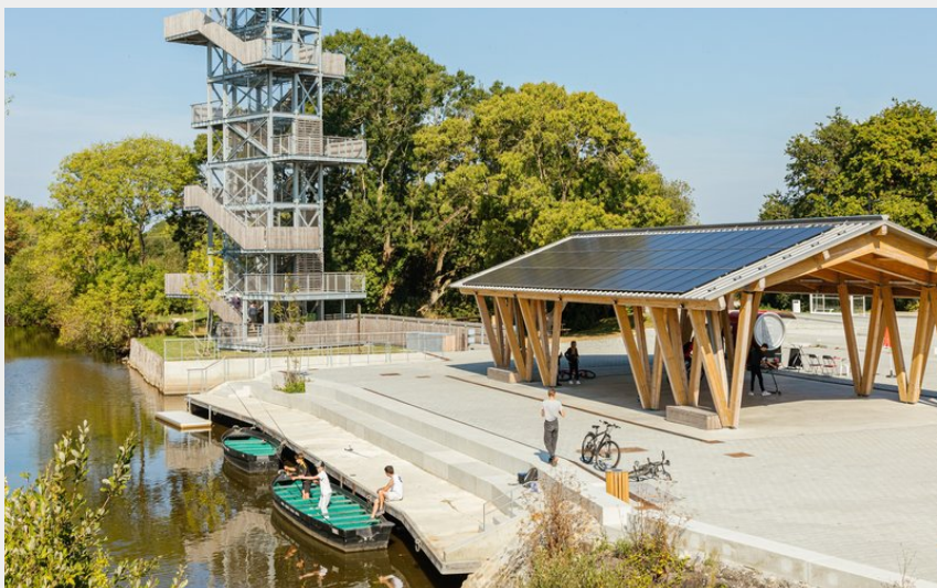
Halle et belvédère de Rozé (Destination Côte Atlantique – Farid Makhoulf)