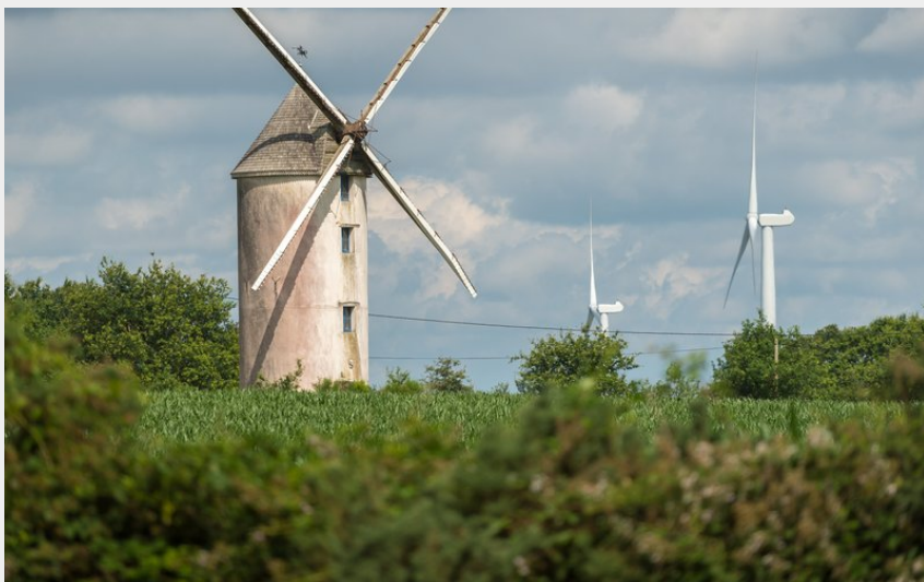
Sentier du Moulin - Campbon