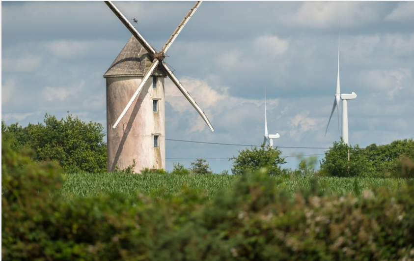
Sentier du Moulin - Campbon