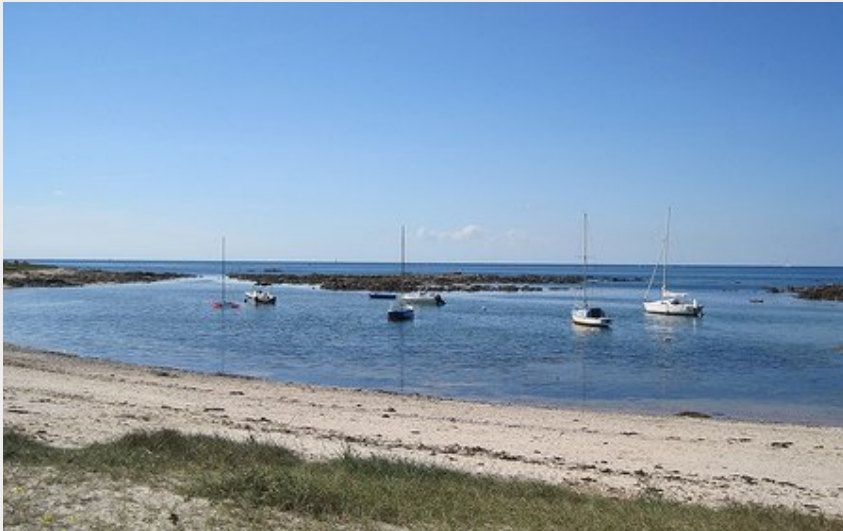
Du sel aux vignes - Le Croisic - Baie de Castouillet_1 (Emmanuel PARENT)