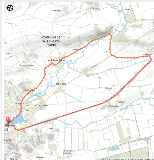
Circuit de la fontaine Mauricette (COMPA)

Au bord de l'Erdre et à travers la campagne, vous découvrirez le pont de la Charlotte, le Bois de Triage et la Fontaine de la Mauricette.