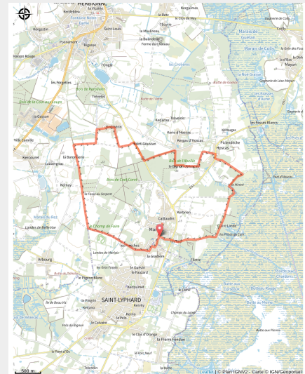
Les bords de Brière_2 (M. Muller)