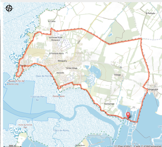
Circuit Entre sel terre - Assérac - chemin_3 (Juliette MARTIN)