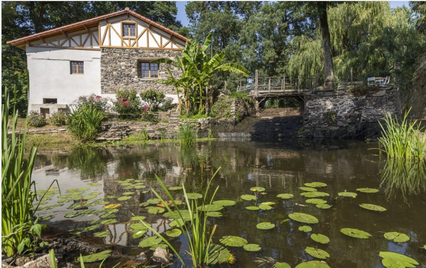
La Sorinière (V.JONCHERAY)