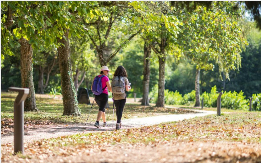
randonnee_pedestre_geneston-2808220002