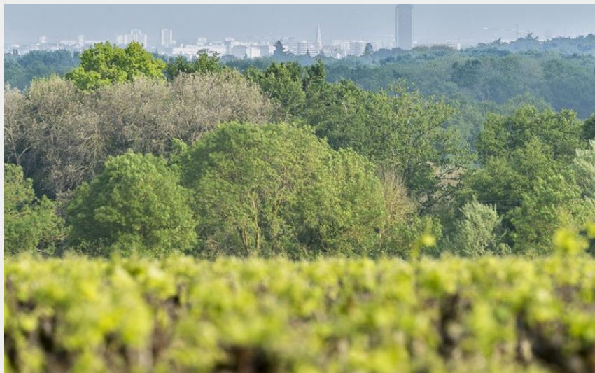
(Stephan Menoret - Nantes-Métropole)