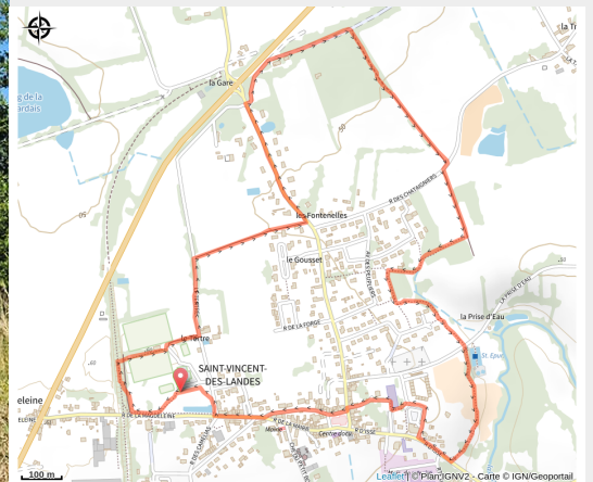
St Vincent des Landes - Sentier des bois (Communauté de Communes Châteaubriant-Derval)

Découvrez ce parcours de randonnée de 4,2 km à proximité de Saint-Vincent-des-Landes.