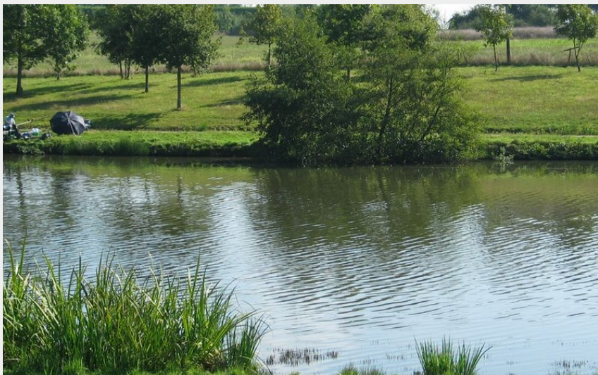
(BOUCLE CIRCUIT LE LAC DES VALLEES MARCHES DE VENDEE VIEILLEVIGNE)