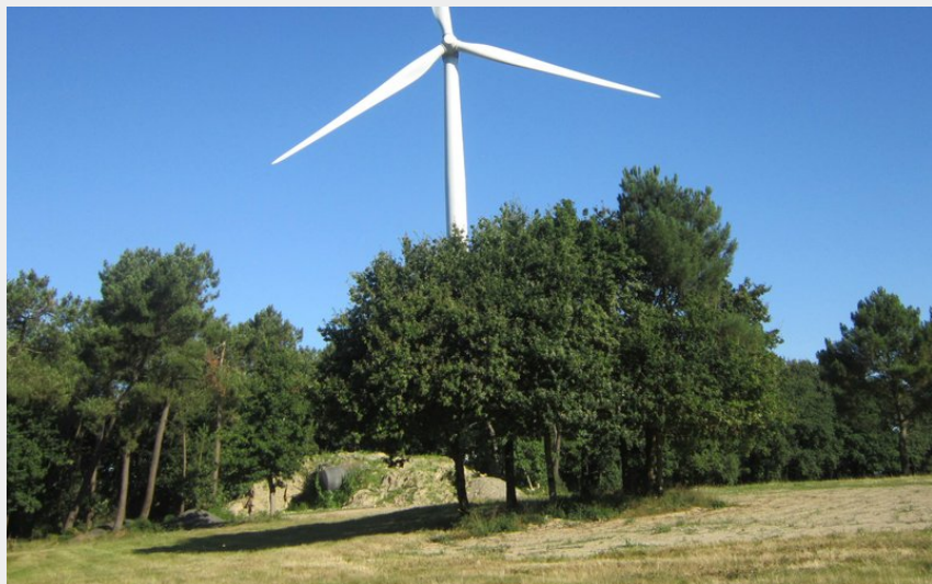
(Office de Tourisme entre Brière et Canal)