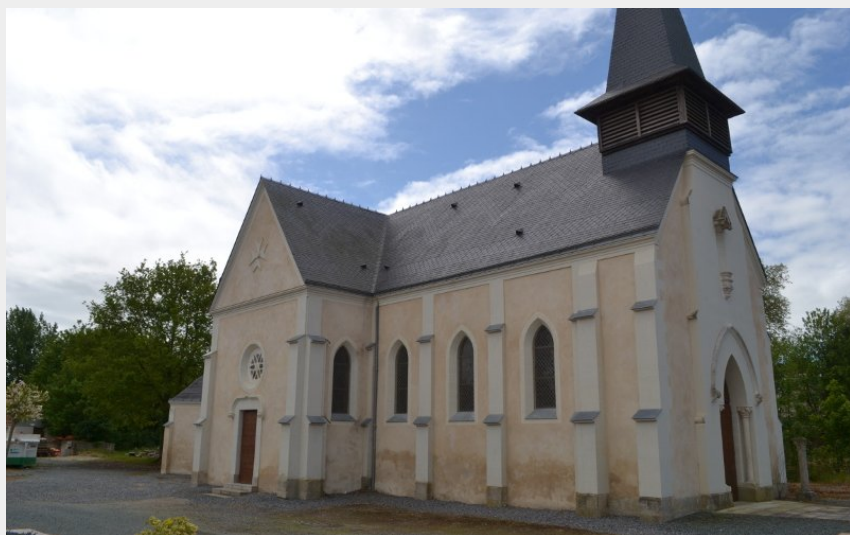
(Office de Tourisme entre Brière et Canal)