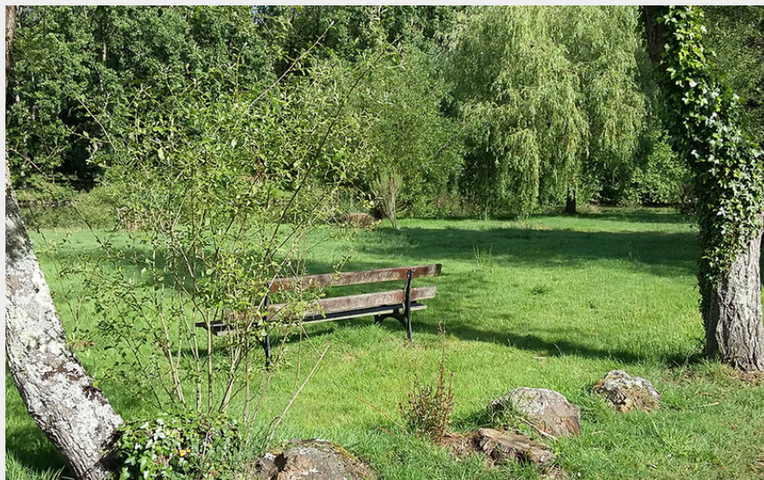
(Anne Collet Bailleul)