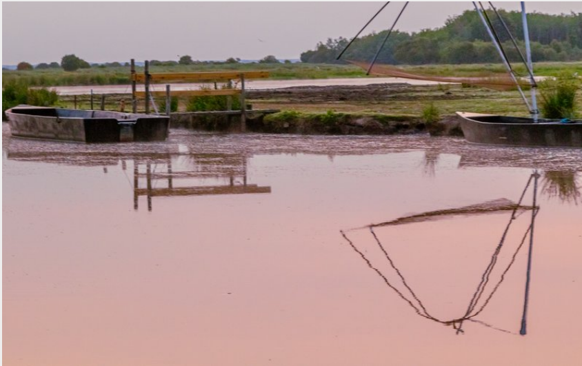
(Farid Makhoulf - L'Humière / Saint-Nazaire Reversante)