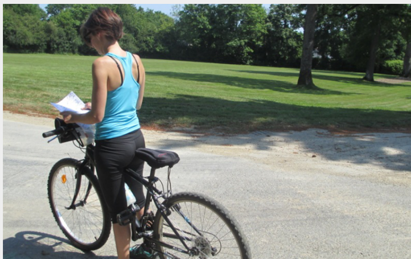
(Office de tourisme Châteaubriant-Derval)