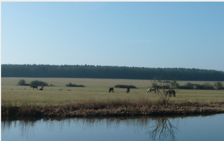
(Office de Tourisme entre Brière et Canal)