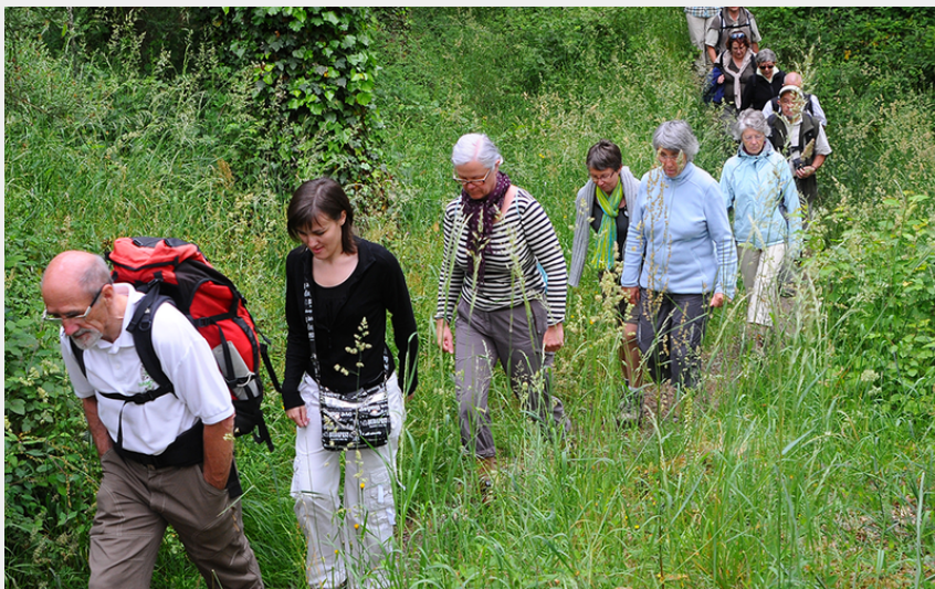
(Association Rando Mée)