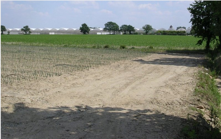
(circuit les maraichers les sables LA PLANCHE)