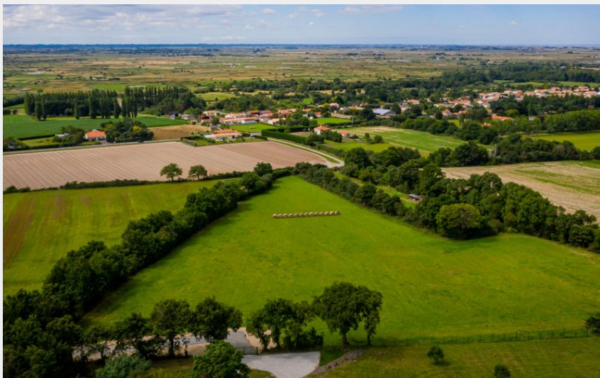
(Le Photographe du Dimanche)