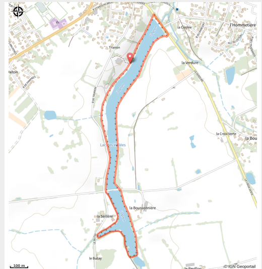
(BOUCLE CIRCUIT LE LAC DES VALLEES MARCHES DE VENDEE VIEILLEVIGNE)

Entre lac, prairies verdoyantes et pâturages