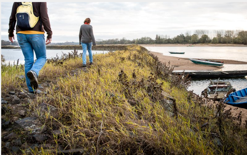
La Grande Prée