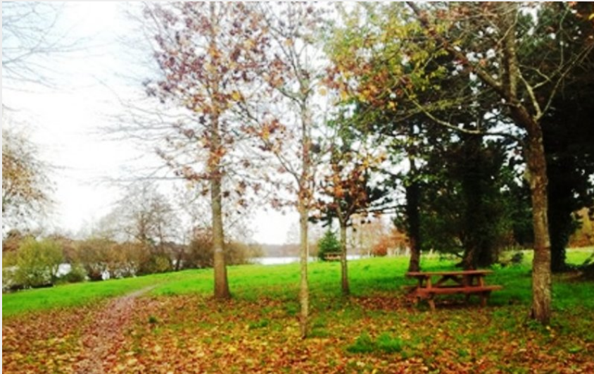
(© F. OSMAN)