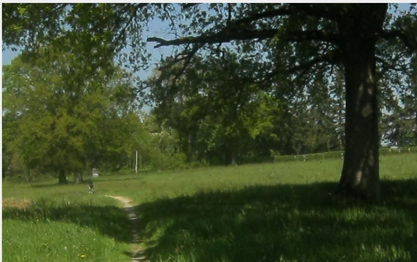
(Anne Collet Bailleul)