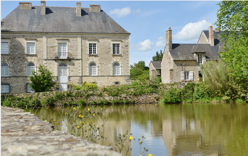
(Communauté de Communes Châteaubriant-Derval)