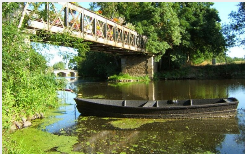
(Mairie de Saint Philbert de Grand Lieu)