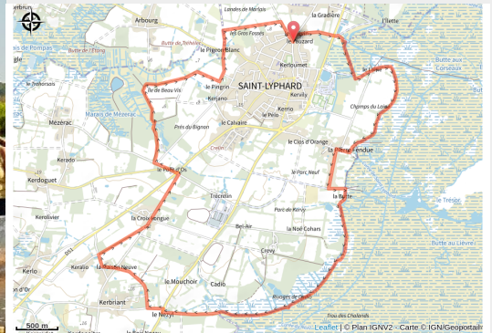
Balade en chaland, Saint-Lyphard en Brière_5 (Alexandre Lamoureux)