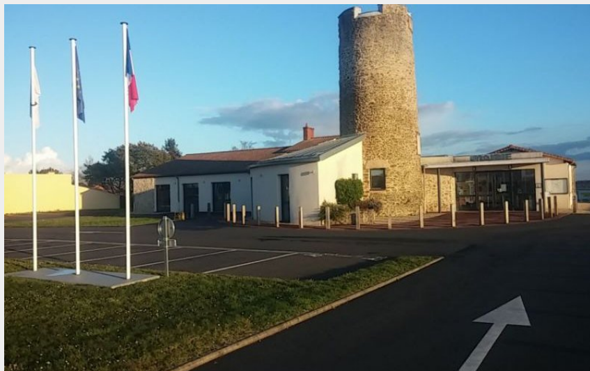
(F Denis Saint-Léger-les-Vignes)