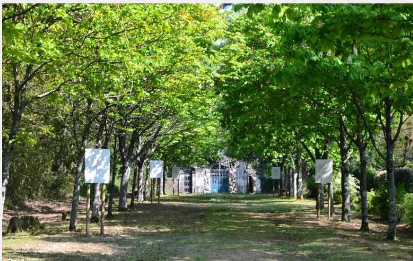
allée des poèmes_7 (Office de Tourisme entre Brière et Canal)