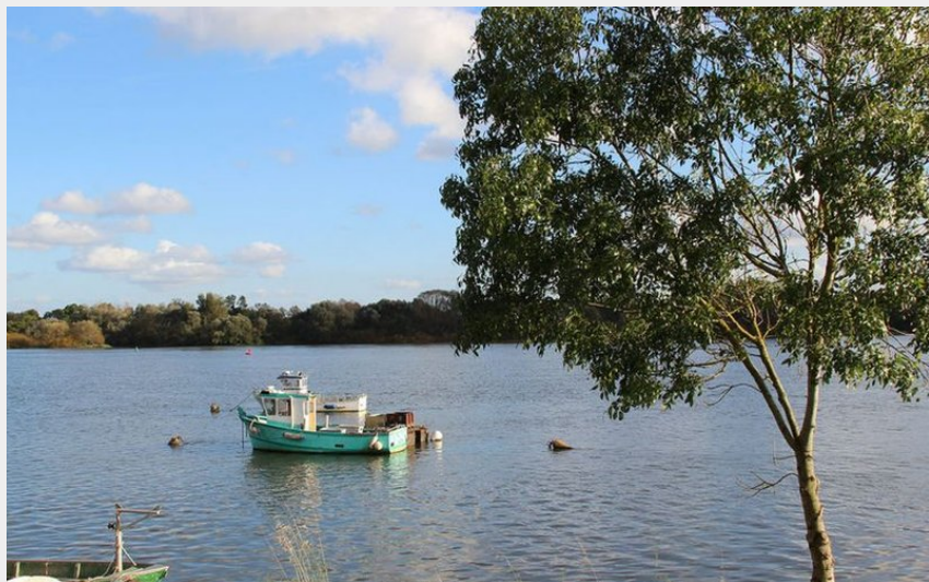
(Ville de Sainte-Luce-sur-Loire)