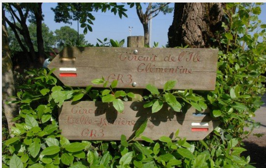
(© Patrick Garçon - Nantes Métropole)