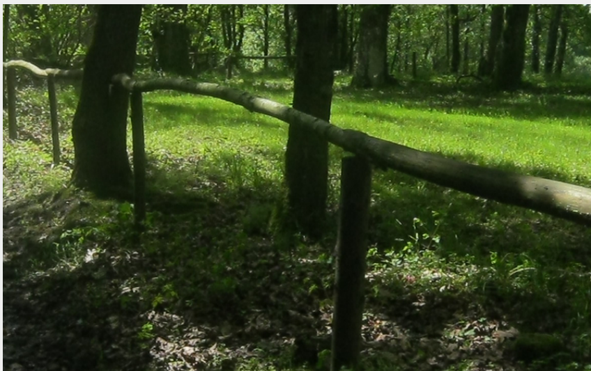
(Anne Collet Bailleul)