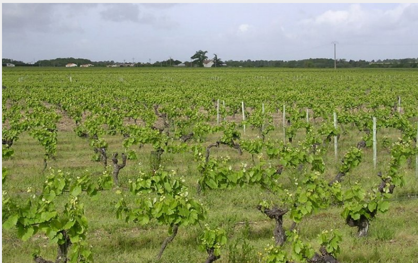
(CIRCUIT ENTRE MAINE ET GORGEAT REMOUILLE)