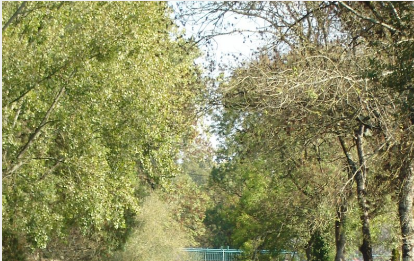
Quai des Romains (OTGL)