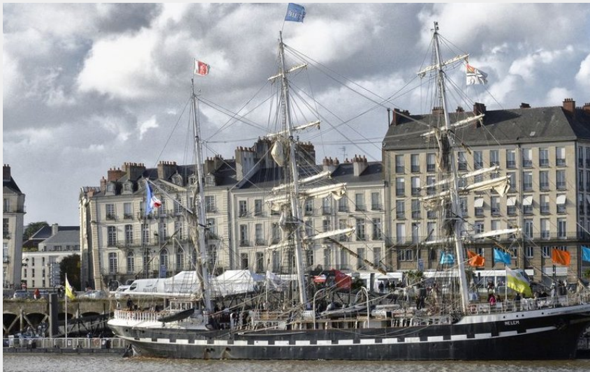
(Rodolphe Delaroque - Ville de Nantes)