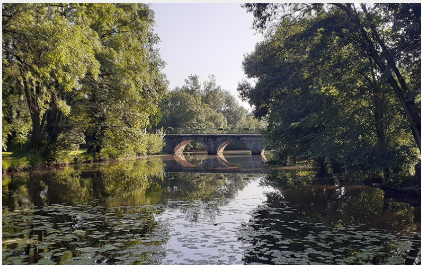
(Communauté de Communes Châteaubriant Derval)