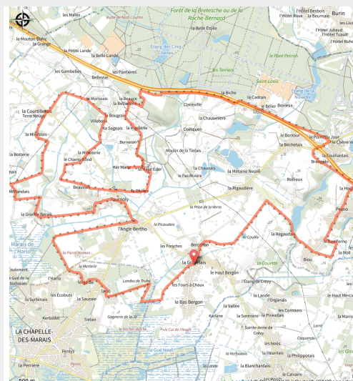
Circuit Brière et Moulins_3